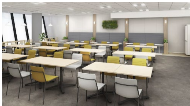
リフレッシュエリア